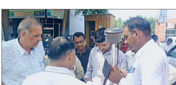
लोहारू। बस स्टैंड के नजदीक हरियल पार्क की जमीन की पैमाइश करते हुए नपा अधिकारी व कर्मचारी।