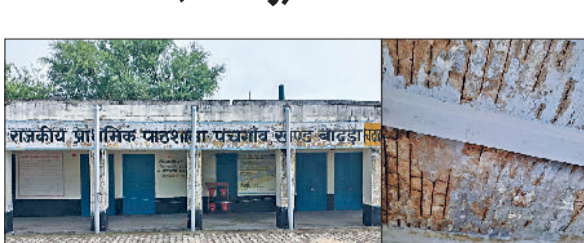
बाढ़ड़ा। राजकीय प्राथमिक विद्यालय का भवन जर्जर भवन का दृश्य व स्कूल के भवन की छत में निकले सरिरे।