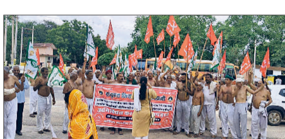
लोहारू। अपनी मांगों को लेकर शहर में अर्धनग्न प्रदर्शन करते किसान।