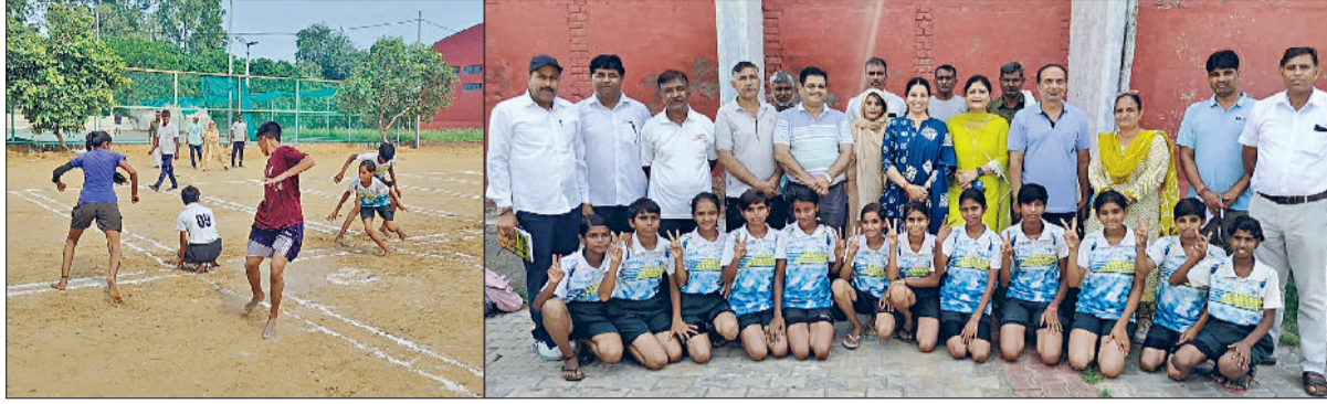
भिवानी। खो-खो मैच में अंक लेने का प्रयास करते हुए व विजेता टीम के साथ खेल प्रशिक्षक एवं अधिकारी।