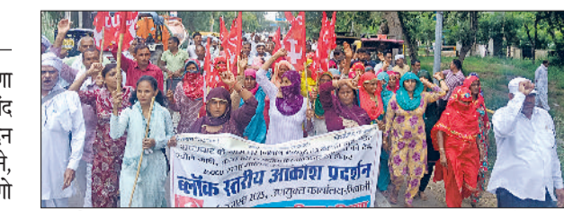
भिवानी। मांगों को लेकर शहर में प्रदर्शन करते हुए।