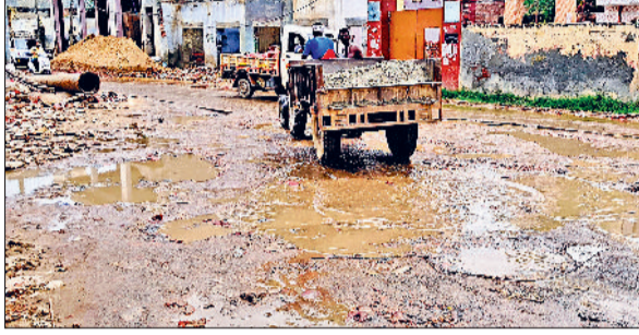
लोहारू। रोड ओवरब्रिज के निकट व्यर्थ में बहता पेयजल, जहां आपदिन हादसे हो रहे हैं।

जलभराव से नष्ट हुई फसलों का जायजा लिया खेतों का दौरा किया और किसान भाइयों की समस्याओं को सुना। उन्होंने कहा कि जलभराव से क्षेत्र के किसानों को भारी नुकसान हुआ है लेकिन विडम्वना की बात है कि ना सता पक्ष और न ही विपक्ष के नेता उनकी आवाज उठा रहे हैं। उन्होंने कहा कि आजपा विधायक तो अपने पूर्ववर्ती विधायक के नक्शे कदम पर चलते हुए यहां की जनता से दूर सता का सुख भोग रहे हैं, वहीं कांग्रेस के सांसद जयप्रकाश जेपी भी झूठे आश्वासन के दम पर यहां की