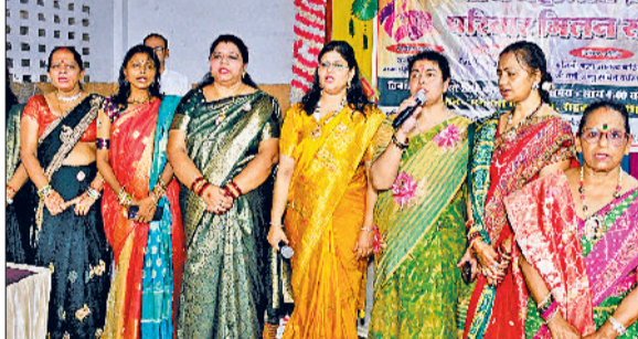
मिवानी। सांस्कृतिक कार्यक्रमों की प्रस्तुति देती महिलाएं।